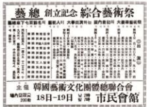
동아일보 1961년 1월 8일