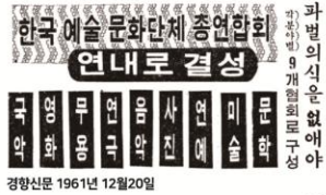
경향신문 1961년 12월 20일

○ 예총 결성을 위한 창립위원회 개최 국악, 영화, 무용, 연극, 음악, 사진, 연예, 미술, 문학 9개 협회로 출발