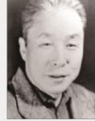
초대 유치진 회장