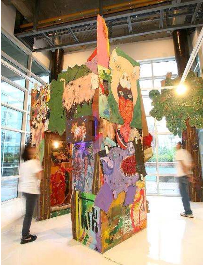
2007 Ver. 9 하지원 & 이소연-soya와 haji의 스튜디오 ( 9. 5- 9.29)