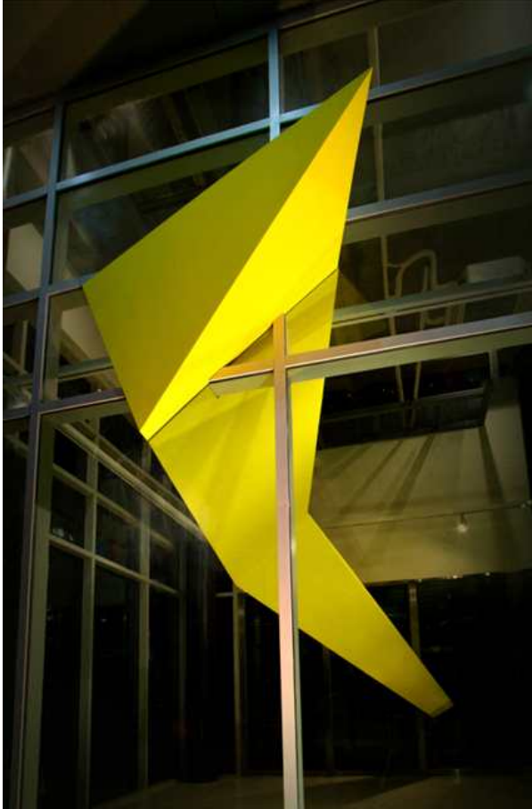
2012 Ver. 3 박정현-aA : from art to Architecture ( 6.1- 7.8) / 코디네이터 노경환, 유창재